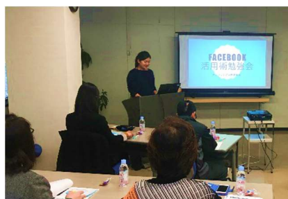
kintone Café Vol.2