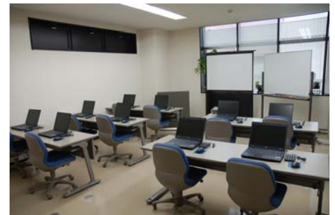
【新設したネットリンクスセミナールーム】